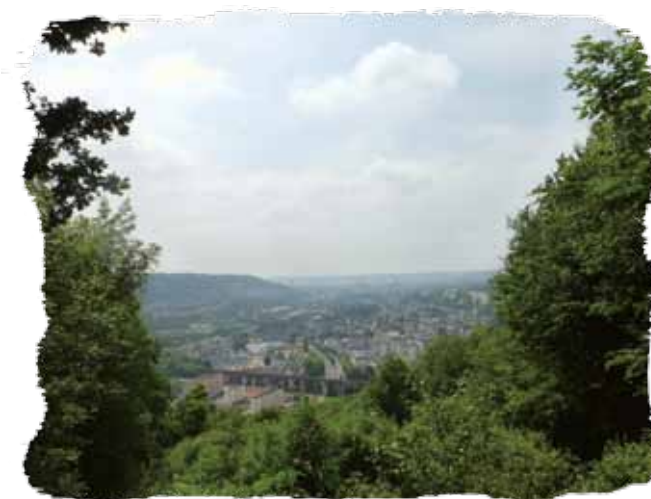
Panorama du bois du Roule

Prenez le sentier le long du collège Émile Chartier jusqu'au parking du point de départ.