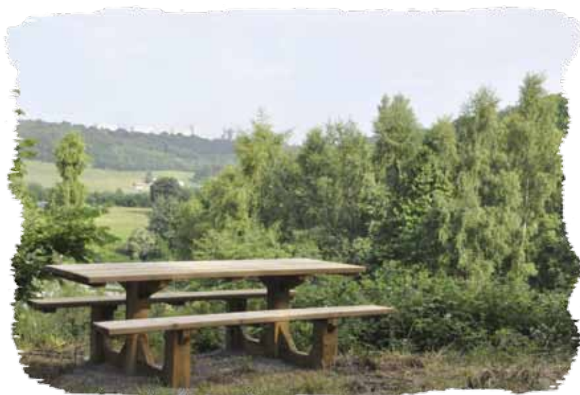
Parc des Terres de la Côte