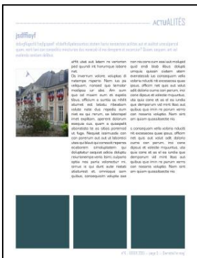
Page 7, 11 ou 13