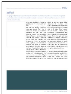
Page 7, 11 ou 13